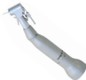
CA MOD. 5060 - 16:1 495,00 EUROS