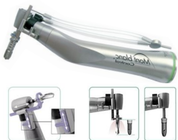
MONT BLANC CONTROL - 20:1 930,00 EUROS