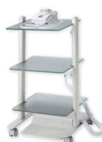
CARRO - C3RV