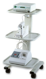
CARRO - C3R